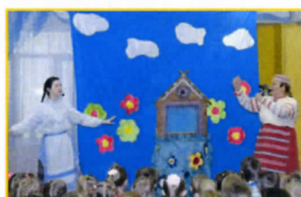
Театр «Зеркало» со спектаклем «Щуча»

Ребята всегда с нетерпением ждут приезда в детский сад приезжих артистов. Сказочные декорации, красивая веселая музыка и интересные сказки завораживают детей. Ребята с интересом следят за героями, вместе с ними веселятся, переживают, поют и помогают им.