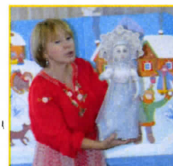
Театр «Свет и вода» со спектаклем «Широкая масленица»